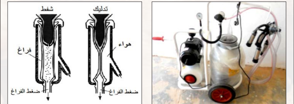
مبدأ إستغلال آلة الحلب

ينصح باعتماد مستوى عال نسبيا من الفراغ 45 - 48 kPa ومستوى تردد نبض منخفض 60 cpm على أن تكون نسبة النبض 40/60 أي 60% شفط و40% تدليك.