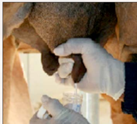
2 - التخلص من القطرات الأولى

يعتمد الحلب الآلي على أربع مراحل أساسية مجسمة في الصور التالية :