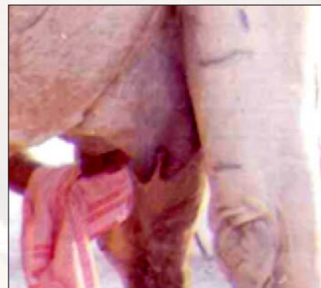
1- تنظيف الضرع